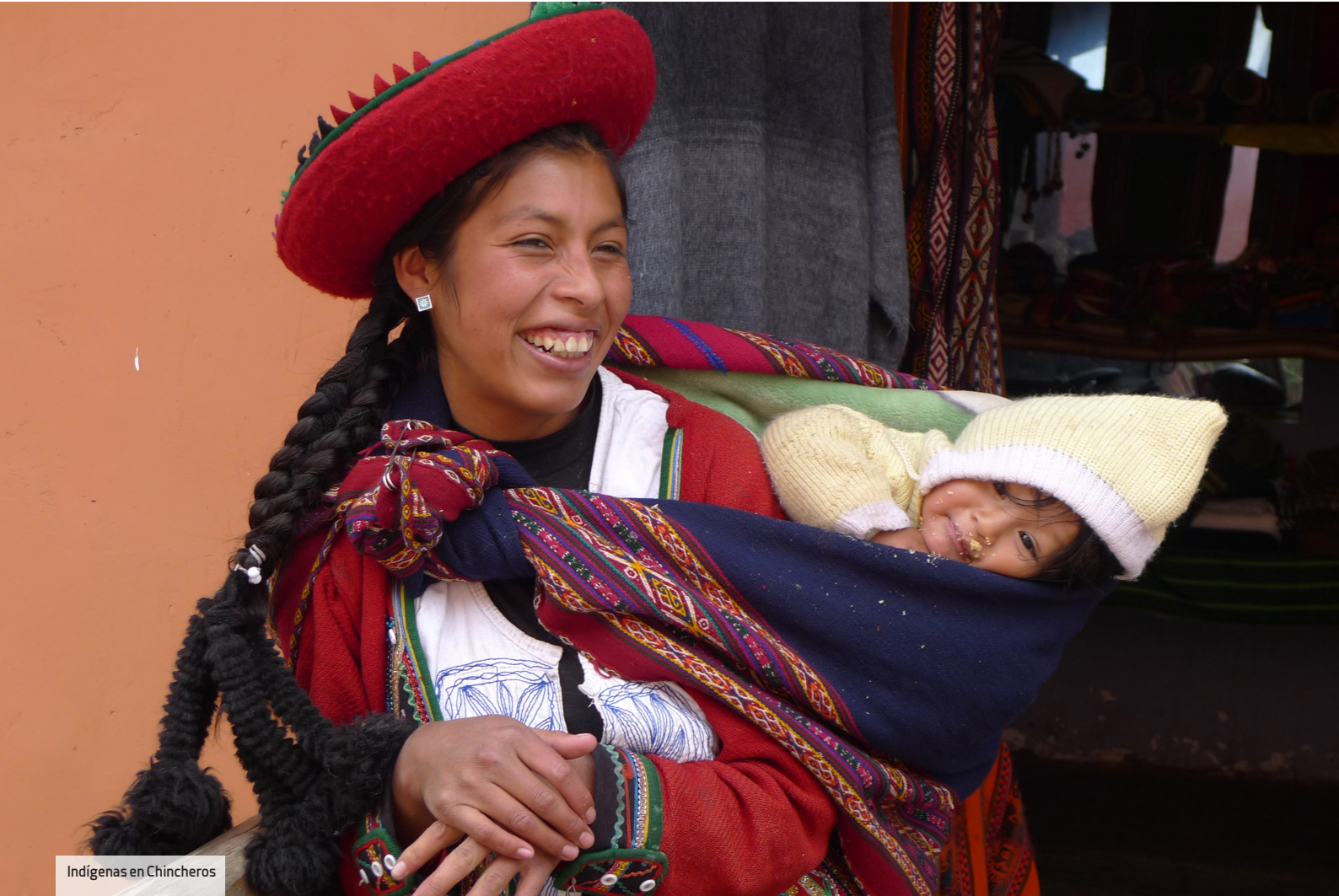
Indígenas en Chincheros

La afluencia de gente es lo único que puede restar algo de interés a la visita de este recinto único en el mundo. Aunque el explorador estadounidense Hiram