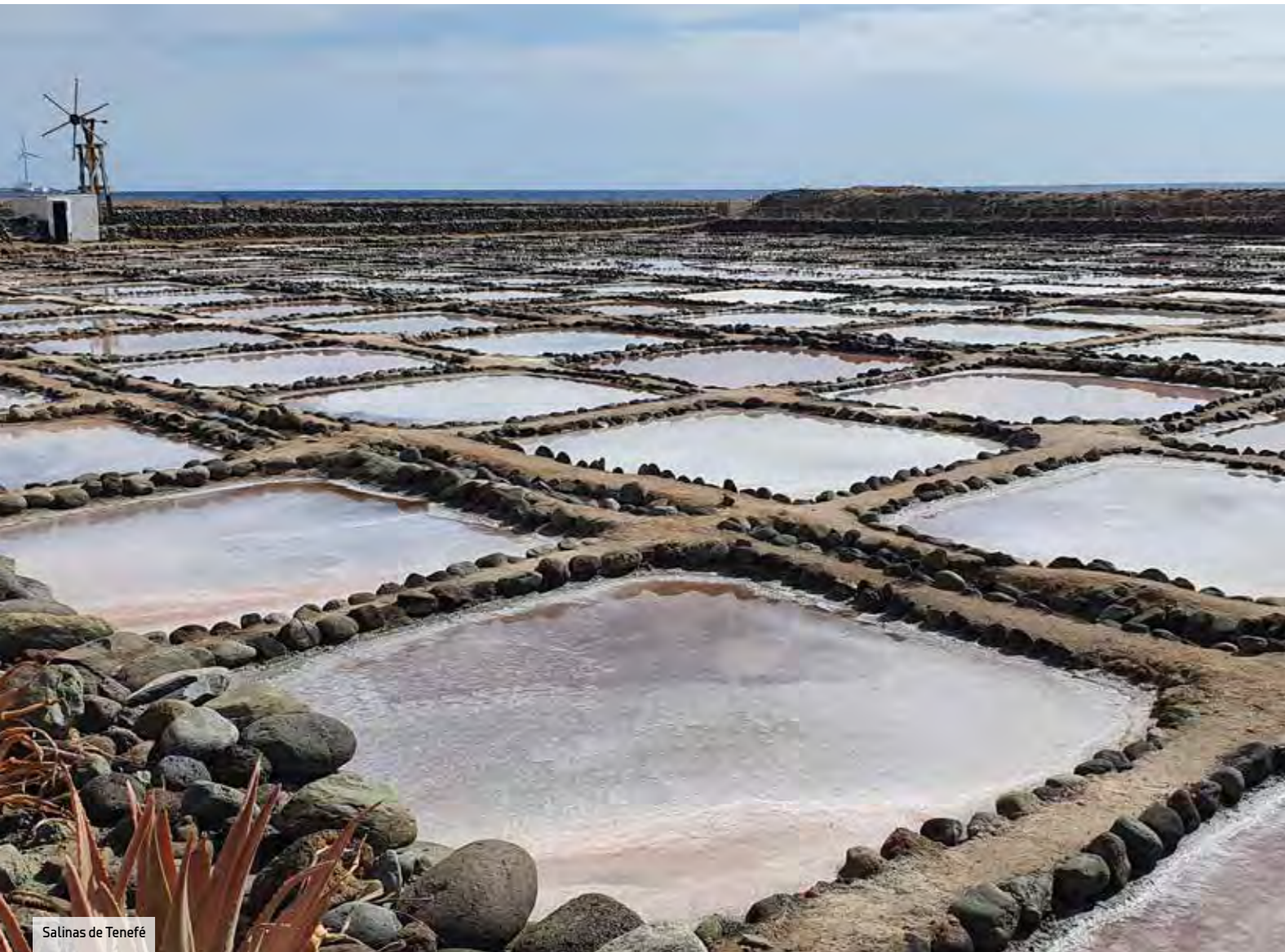
Salinas de Tenefé

Anfi del Mar es un complejo dotado de una playa e isla artificial donde los grupos pueden desembarcar. Hasta 1.000