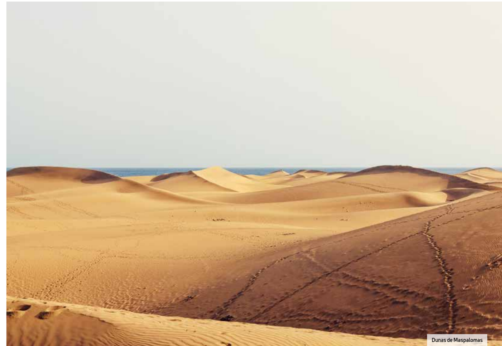
Dunas de Maspalomas

La misma propiedad cuenta dentro del palmeral con el Seaside Grand Hotel Residencia , un cinco estrellas Gran Lujo de 94 habitaciones que figura en lo más alto de la lista de los mejores hoteles de Gran Canaria.