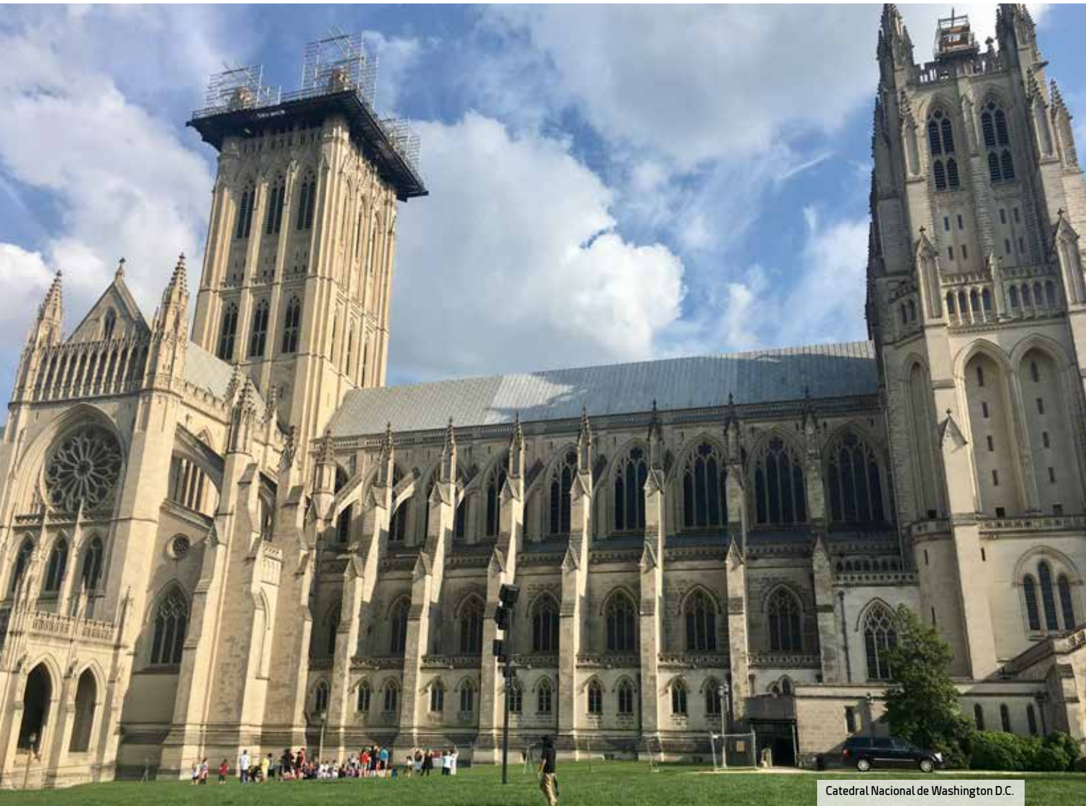
Catedral Nacional de Washington D.C.

Y, para quien busca sorprender, la Catedral Nacional de Washington también es sede de espectaculares cenas de