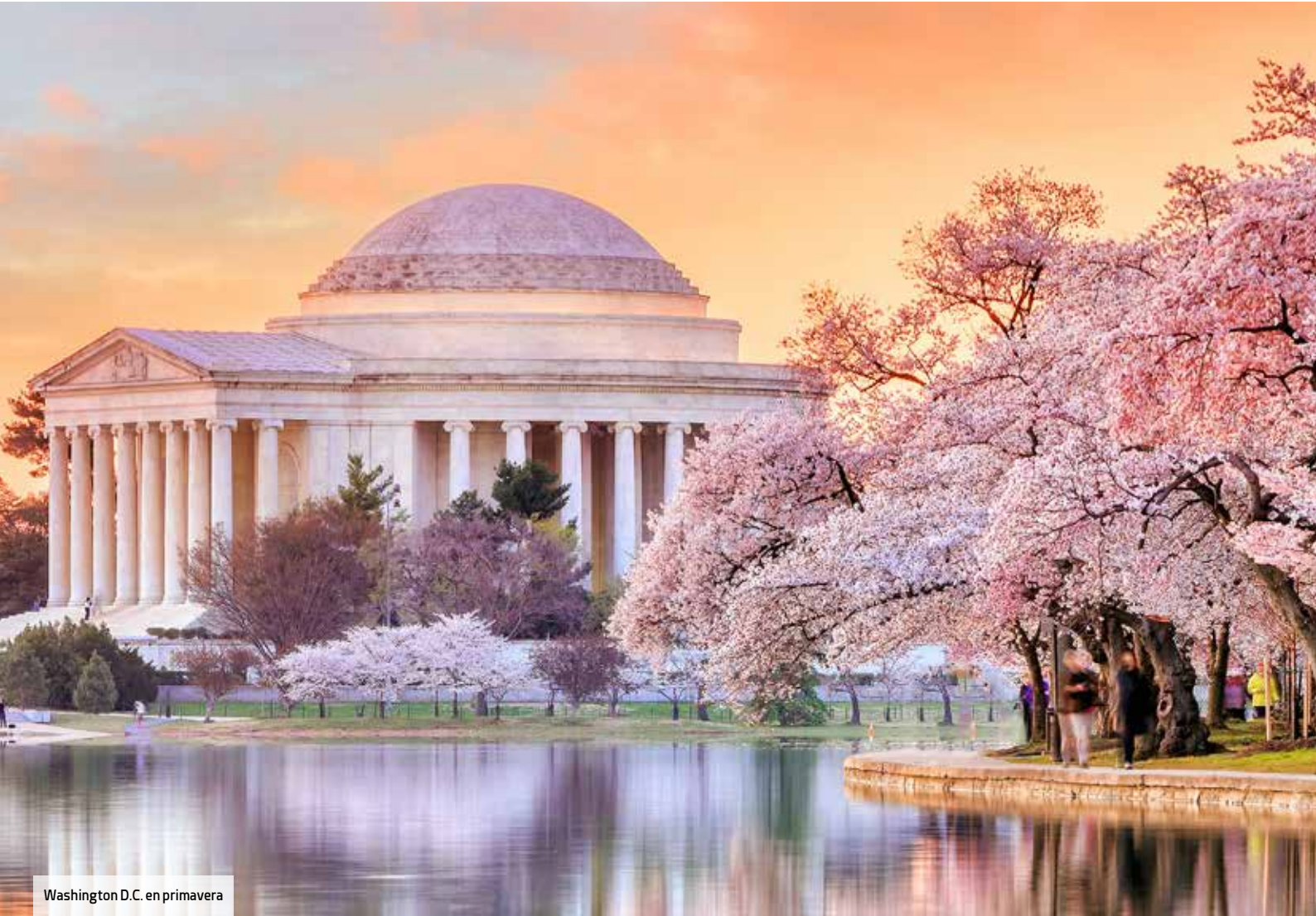
Washington D.C. en primavera

No todo son edificios gubernamentales y museos en Downtown. En septiembre del año pasado se inauguró The Roost , un innovador food hall o espacio gourmet en Capitol Hill con diferentes puestos de comida y bebida de proveedores y cocineros locales. Es el lugar ideal para recargar pilas durante la visita, codeándose con los habitantes que acuden aquí los fines de semana a por su brunch de las 11 de la mañana.