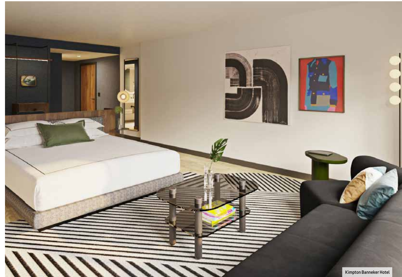
Kimpton Banneker Hotel

El Four Seasons Hotel Washington DC , un establecimiento de cinco estrellas con 222 habitaciones, es una de las opciones más utilizadas en Georgetown para grupos de incentivo. Cuenta con un spa y centro de fitness que ocupa tres pisos, un reconocido restaurante especializado en carnes y más de 2.000 m 2 de espacio para eventos, incluyendo amplios jardines y patios.