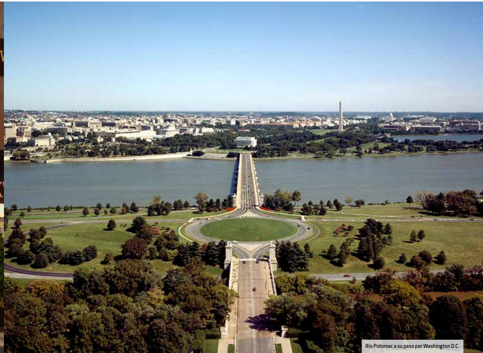
Río Potomac a su paso por Washington D.C.

Pertenece al grupo Viceroy Hotels and Resorts, que cuenta con otra propiedad en la zona, también recientemente renovada. El Viceroy Washington DC combina lujo y modernidad en sus 178 habitaciones. En su café bar se mezclan cada mañana huéspedes y residentes locales. Ofrece 500 m 2 de espacio para eventos.